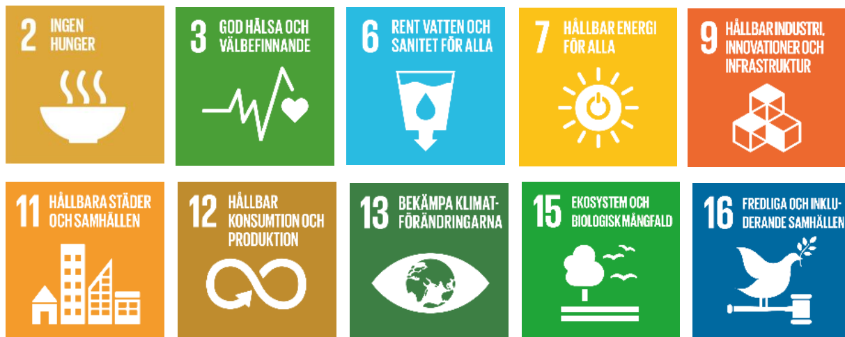
Figur 6: Agenda 2030-mål.