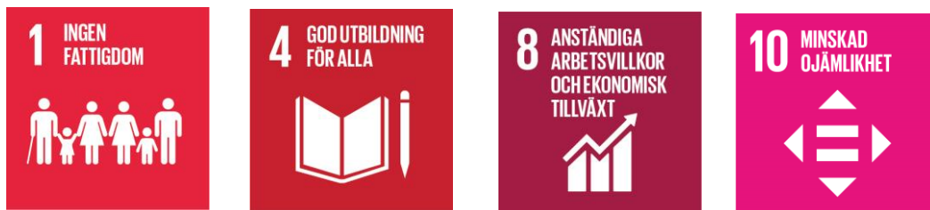
Figur 4: Agenda 2030-mål.