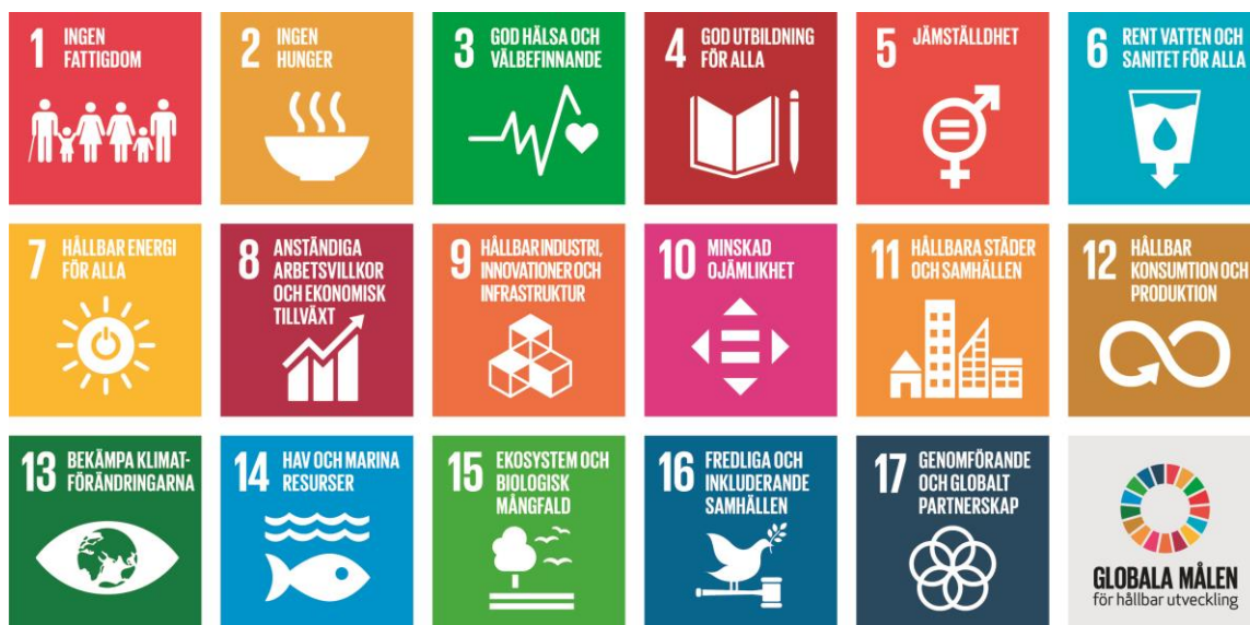
Figur 2: Agenda 2030 globala mål för hållbar utveckling.

Söderhamns kommun arbetar för att integrera FN:s globala mål för hållbar utveckling, Agenda 2030, i kommunen och de globala målen i kommunens styrning. Målet är att hållbarhet inom de tre segmenten; människorna, planeten och välbefinnandet, ska genomsyra alla verksamheter. Till grund för arbetet har kommunen beslutat om flera kommunövergripande planer, program och strategier som bidrar till ekologisk, social och ekonomisk hållbarhet.