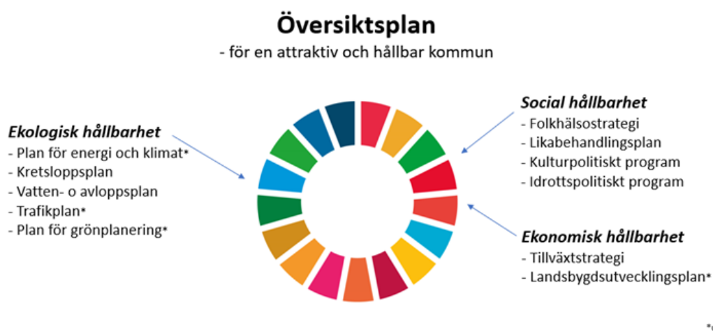
Figur 3: Kommunövergripande styrdokument inom hållbarhet.

Arbetet för ekonomisk hållbarhet har sin grund i de finansiella målen som beslutas av kommunfullmäktige. Kommunen har även en tillväxtstrategi med mål om att kommunen ska växa och ha 28 000 välmående invånare år 2030.