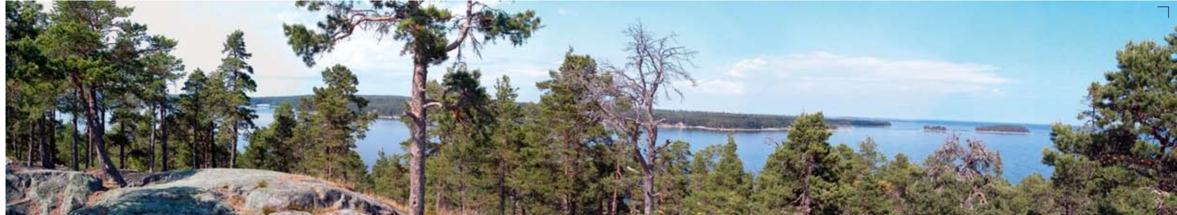
Utsikt från Skatberget