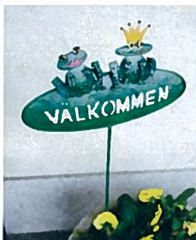
En liten anspråkslös skylt i entrén hälsar besökarna till Västerbacken välkomna.