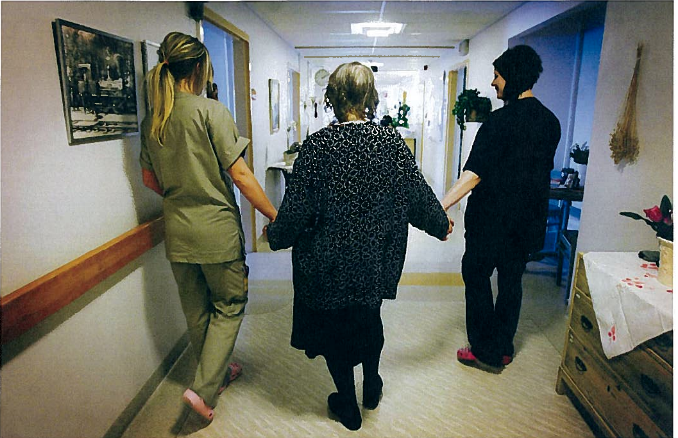
Många kommer till Västerbacken när det inte går att bo kvar hemma längre. De allra flesta som kommer väntar på en plats i ett äldreboende. Andra kan åka hem igen, om hälsan blir bättre.