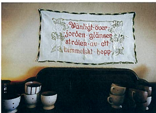
Väldigt mycket kretsar kring maten och kaffestunderna. Än så länge lagas all mat på sjukhuset. Från den 1 maj ska Åsgården ta över matlagningen.