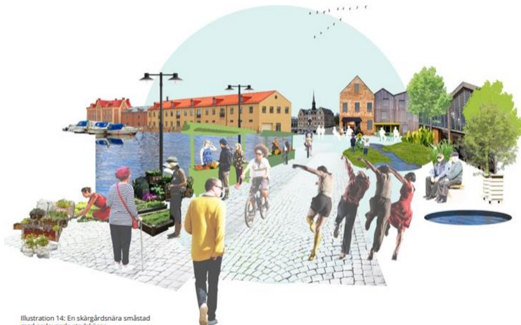
Illustration 14: En skärgårdsnära småstad med levande stadskärna.

Visionsbild en skärgårdsnära småstad med levande stadskärna.