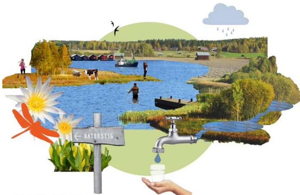
Illustration 16: En grön infrastruktur med stora gröna och blå värden.

Visionsbild en grön infrastruktur med stora gröna och blå värden