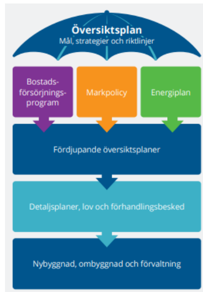
Översikt av planprocessen

Planen ska ge vägledning för efterföljande, men detaljerad planering av mark och vatten. Översiktsplanen har också en central roll genom att formulera strategier för en långsiktigt hållbar utveckling och fungerar också som ett paraplydokument för planer och åtgärder inom ett flertal områden.