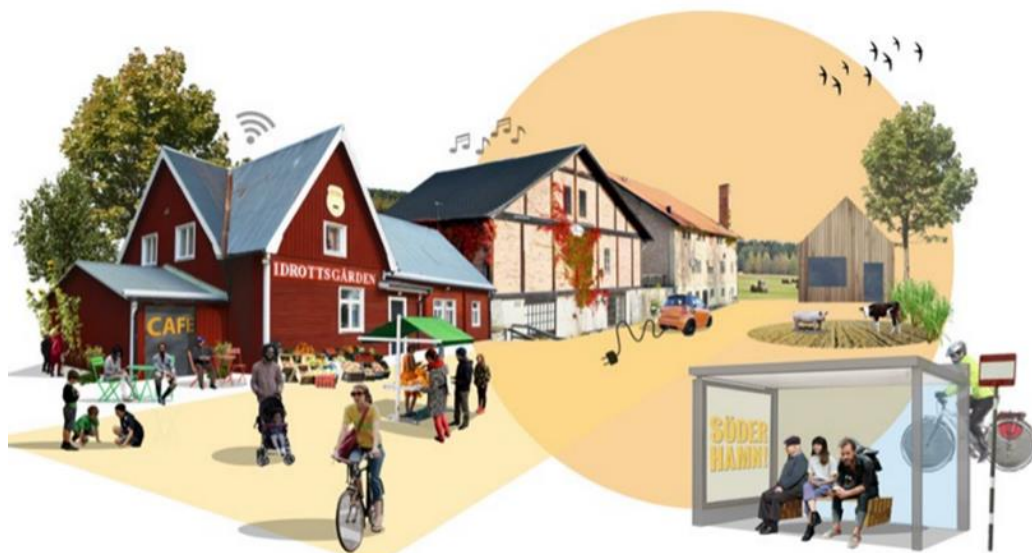
Illustration 13: En levande landsbygd med starka kommundelscentrum.