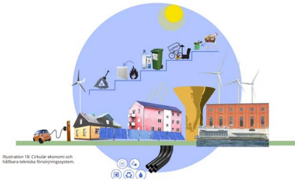
Illustration 18: Cirkulär ekonomi och hållbara tekniska försörjningssystem.

Visionsbild cirkulär ekonomi och hållbara tekniska försörjningssystem.