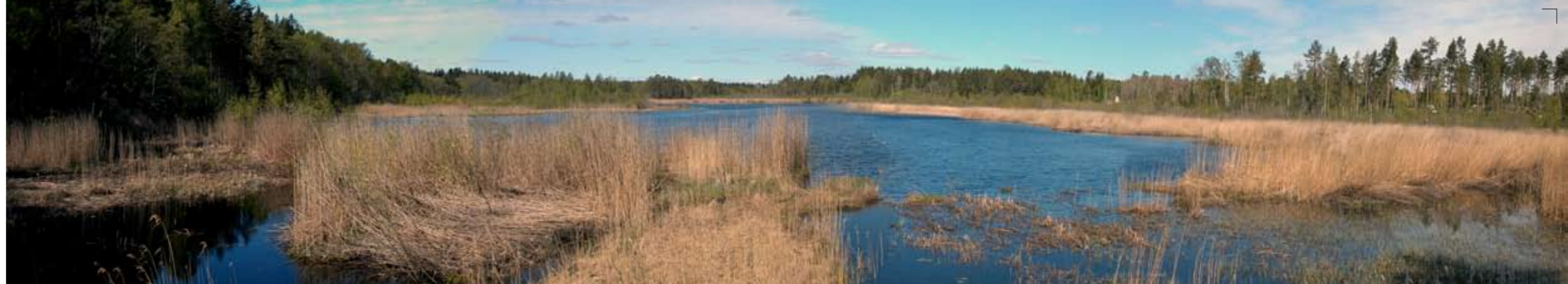
Utsikt från östra fågeltornet

I området saknas toaletter och soptunnor.