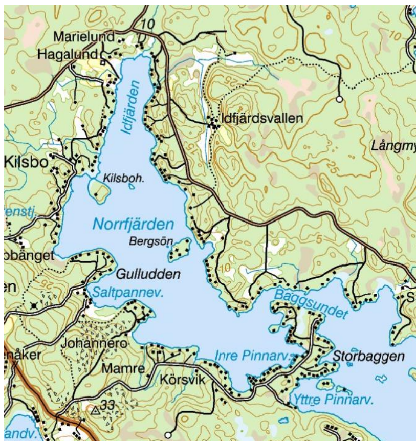
Kartbild över Norrfjärden, som visar att bebyggelsetrycket redan är högt runt fjärden.

I förarbetena (prop. 2008/09:119 s. 65) anges att utrymmet för utpekande av områden bör vara större i de kommuner som har en låg grad av bebyggelsepåverkan vid stränderna. Vidare anges att kommunen noggrant bör beakta om det kan förväntas råda ett högt bebyggelsetryck i ett utpekat område, eftersom det har betydelse för om strandskyddets syften långsiktigt kan upprätthållas. Hur stort utrymmet är att redovisa områden i närheten av en tätort får bedömas utgående från hur stor del av de tätortsnära strandområdena i kommunen som redan har exploaterats. (s. 66)