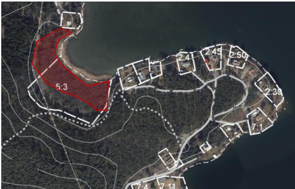
Utpekad nyckelbiotop N 1443-1999

Som nämnts avser strandskyddet både land- och vattenområden. Beträffande landområdet som berörs kan konstateras att det föreslagna LIS-området är beläget i nära anslutning till en av Skogsstyrelsen registrerad nyckelbiotop. (se kartbild nedan)